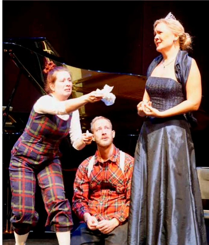
«Askeladden og de gode operahjelperne».

På Den Norske Opera søndag 12. mai deltok « Askeladden og de gode operahjelperne », Thormod Rønning Kvam, Povilas Syrrist-Gelgota & Håvard Svendsrud , « Il Pleur Dans Mon Coeur », Trio No Treble, Rune Alver, Operapub til scenen, Cimbrasso, Duo Orłowski Sosnowski og « Liebeslieder - en hyllest til kjærligheten ».