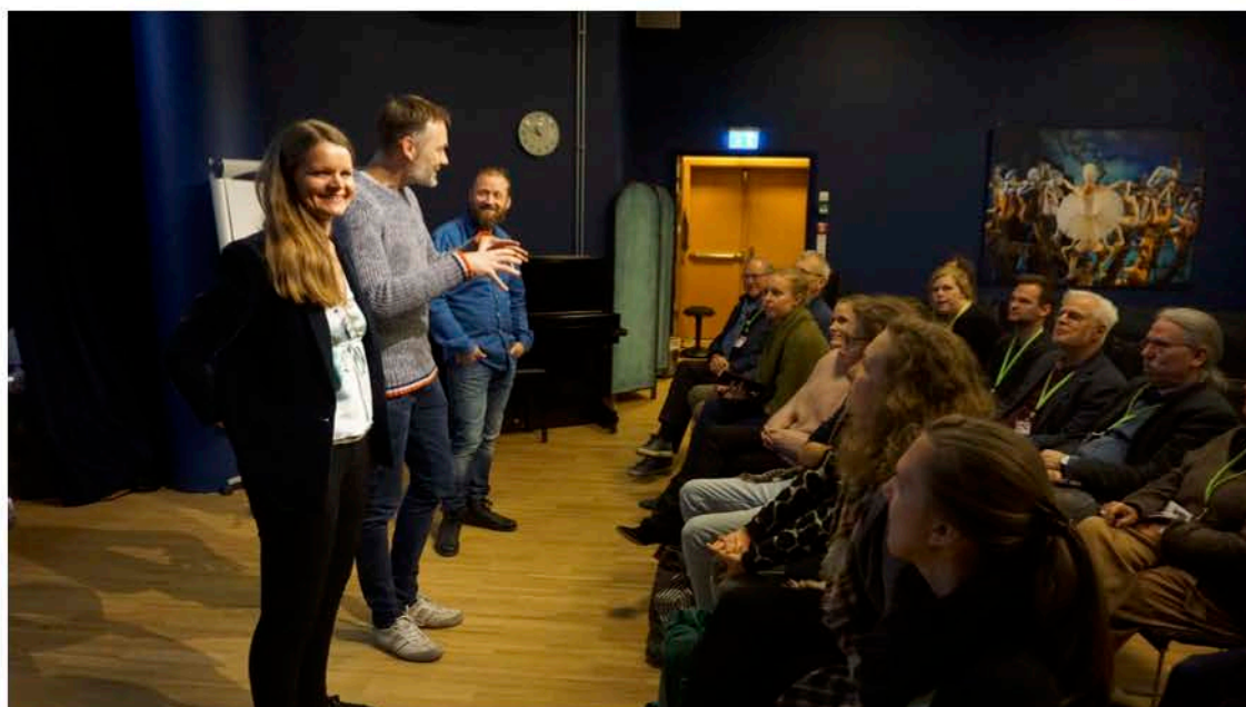
Konsertserien Resonans om publikumsutvikling.

Statistikk over antall verk fremført, antall publikummere totalt, osv., er ikke klart i skrivende stund. Dette vil komme med i oppdatert evalueringsrapport.