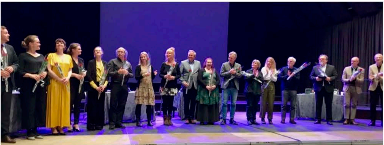
Musikere, deltagere, programleder og dommere i «Kontrapunkt».

En av tilbakemeldingene vi fikk fra forrige arena:klassisk, var mangelen på «mingletid». Dette tok vi ad notam, og vi arrangerte derfor i år «Den Klassiske Sommerfesten» på SALT lørdag den 11. mai. Også nytt av året var «Kontrapunkt», som ble et meget vellykket og populært innslag i programmet.